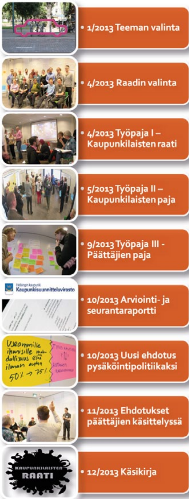
Pysäköintiraadin vaiheet ja aikataulu

Raadin käsittelemän teeman ja siihen liittyvien kysymysten tulee olla haastavia ja avoimia eli sellaisia, jotka eivät ole itsestään selviä tai jo päätettyjä. Lisäksi teeman tulee olla helposti ymmärrettävä ja kiinnostava. Hyvä tema herättää tunteita ja siihen liittyy paljon erilaisia tai jopa ristiriitaisia näkökulmia.