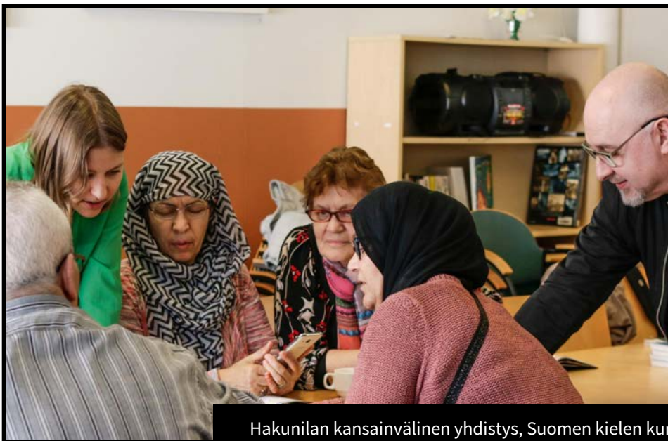
Hakunilan kansainvälinen yhdistys, Suomen kielen kurssi