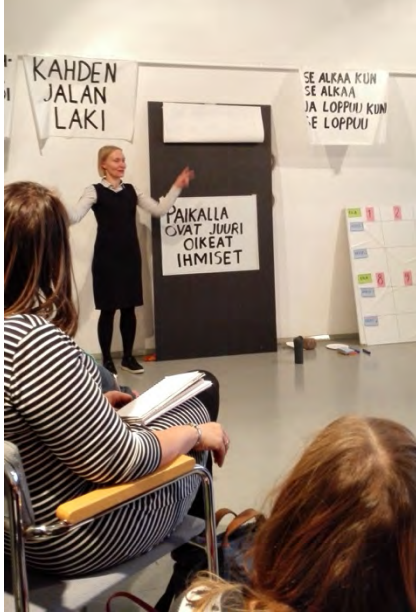
Art of Hosting –koulutuksessa Suomenlinnassa osallistujat kouluttivat toinen toisiaan. Tässä käydään läpi Open Space –menetelmän lähtökohtia.

Vision julkaisemia Yhdistystoimijan opasta ja 10 askelta parempaan vapaaehtoistoimintaan -kirjaa käytettiin oppimateriaalina yhdistys- ja vapaaehtoistoiminnan koulutuksissa. Vision verkkokurssit toteutettiin keväällä 2016 Adobe Connectin avulla ja kesästä 2016 lähtien Vision uudella verkkokoulutuslavalustalla Eliademyssä, joka on alustana monipuolisempi mahdollistaen mm. koulutusmateriaalien paremman arkistoinnin, erilaiset keskustelualustat jne.