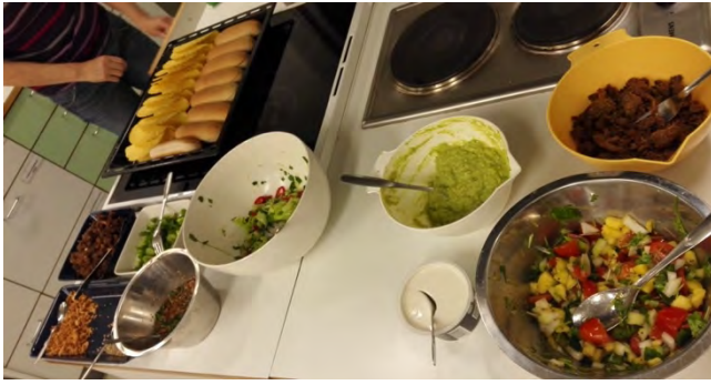
Nyhtökauraa pöytään –kurssilla loihdittiin muun muassa korealaisia chilihodareita nyhtökaurasta.

Syksyllä 2016 alettiin myös suunnitella maahanmuuttajien kielten opettajien käyttöön tarkoitettua ympäristökasvatusmateriaalia, johon Visio sai rahoituksen ympäristöministeriöltä. Syksyllä koottiin hankkeelle ohjausryhmä, johon kuului kieltenopettajia, maahanmuuttajakoulutusta järjestävien järjestöjen edustajia, ympäristöasiantuntijoita sekä maahan muuttaneita. Ohjausryhmä kokoontui syksyllä kaksi kertaa. Ohjausryhmän keskuudessa määriteltiin yleiset suuntaviivat materiaalille ja pohdittiin tapoja, joilla se vastaisi kohderyhmän tarpeisiin ja kiinnostuksen kohteisiin mahdollisimman hyvin.